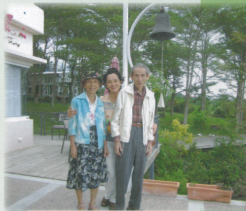
✕ 作者與父母攝於都蘭 Rose Villa ✕

所以，身為成長班一員的同學們，我衷心期盼每一位同學都能勇於承擔班長的責任，因為這是一個能讓你快速成長的機會，既然進入成長班，當然要勇於成長囉！