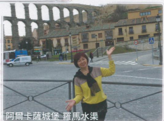
阿爾卡薩城堡 羅馬水渠