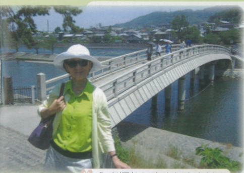
✕ 作者攝於日本京都宇治橋 ✕

◇發行人 / 大直高中 溫馨父母成長班 ◇地址 / 台北市北安路420號 電話：2533-4017 #152 主編：林嘉珍 ◇成長班網址 www.dcsb.tp.edu.tw/ 首頁/團體與組織/溫馨父母班 ◇版面設計 / 嘉群印刷事業有限公司 電話：(02)2799-5667