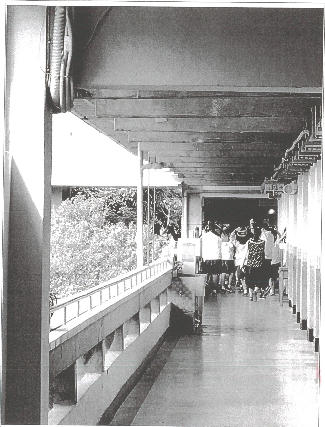
說明：避難引導班(引導人員往外疏散之動作)