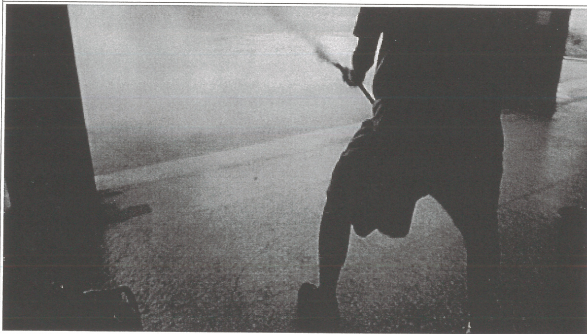
說明：滅火班(滅火器操作)