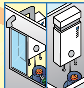
密閉或半密閉強制排氣型