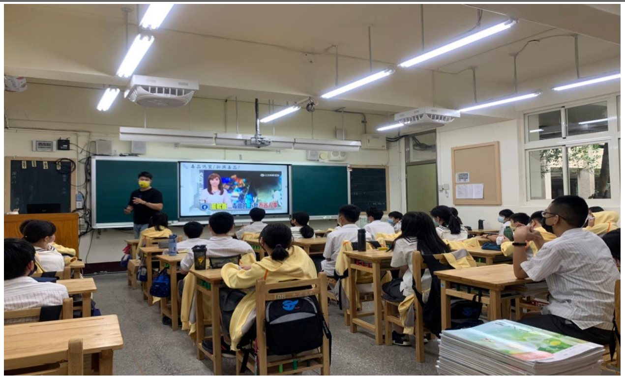
說明：反毒守門員入班宣教