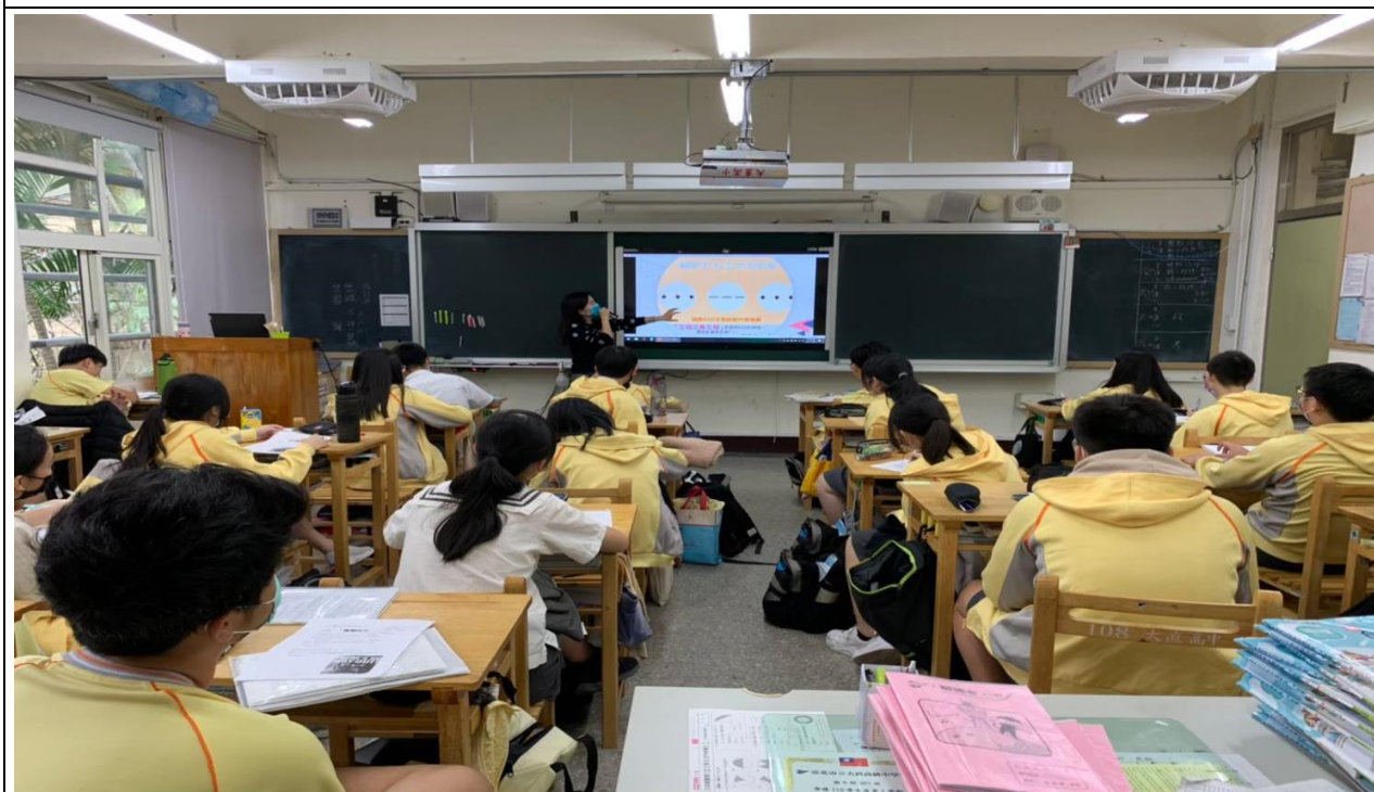
說明：110.11.30 運用童軍課程教授國際 SOS 求救訓練