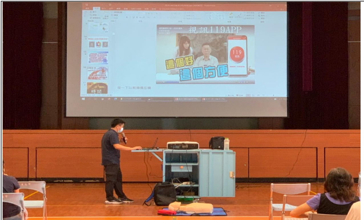
說明：CPR/AED 操作教育訓練