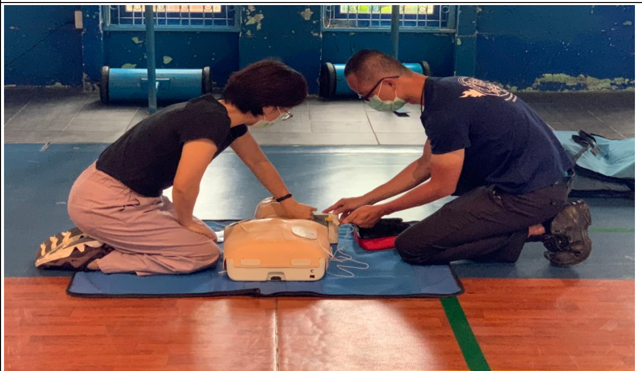
說明：CPR/AED 操作教育訓練