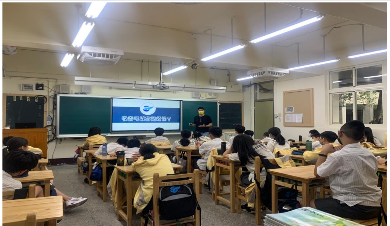
說明：反毒守門員入班宣教