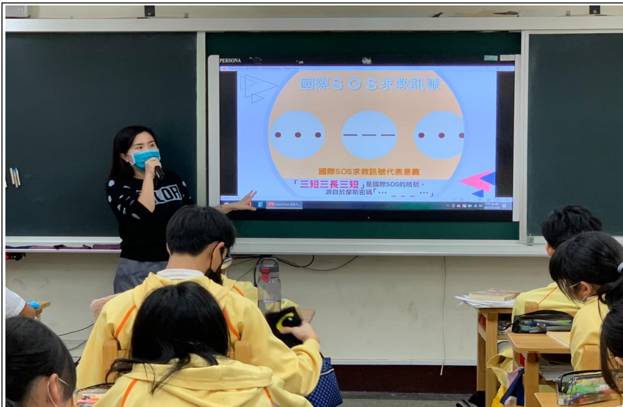
說明：110.11.30 運用童軍課程教授國際 SOS 求救訓練