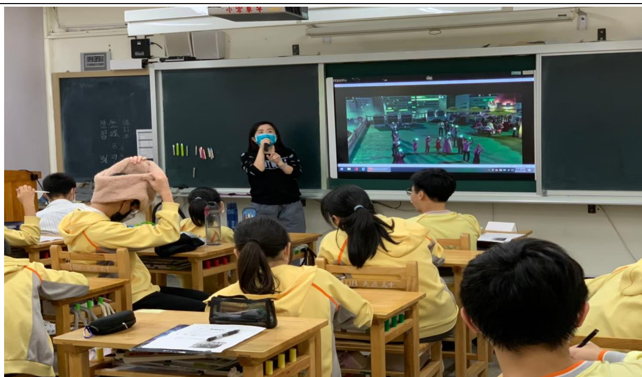
說明：110.11.30 運用童軍課程教授國際 SOS 求救訓練