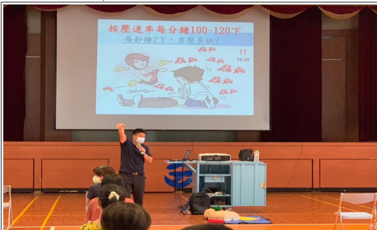
說明：CPR/AED 操作教育訓練

110 學年將防災教育融入至少 3 項課程領域，以教學、競賽、示範觀摩及實作演練(如急救包紮、CPR 及 AED 實作等)等方式實施。成果照片粘貼用紙