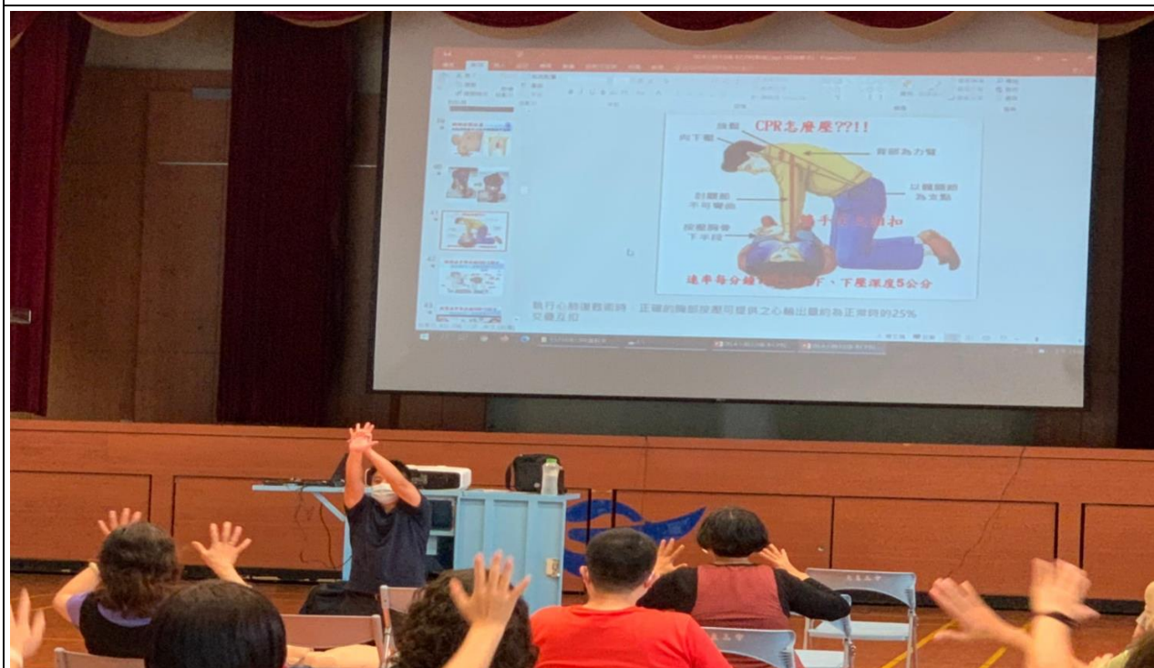
說明：CPR/AED 操作教育訓練