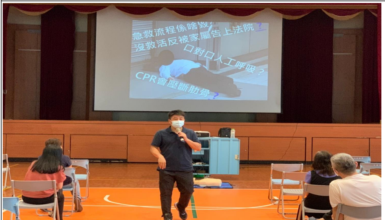
說明：CPR/AED 操作教育訓練