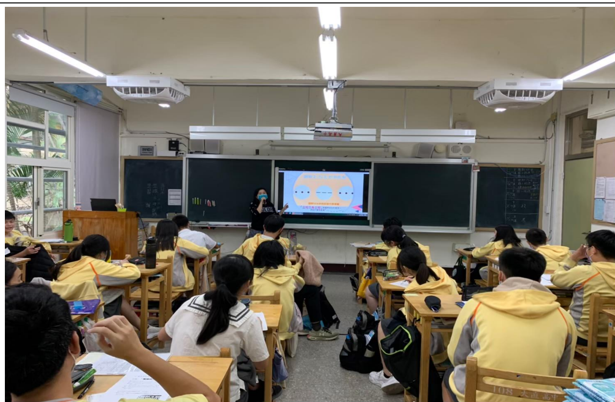
說明：110.11.30 運用童軍課程教授國際 SOS 求救訓練