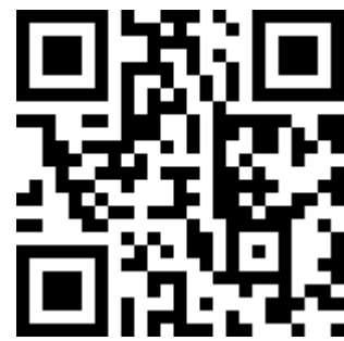
家庭防災卡填寫說明 QR Code 歡迎下載運用

請注意本校統一由【大直高中校園防災教育 FB 粉絲頁】公告災害訊息，也是唯一告知家長的通訊管道。