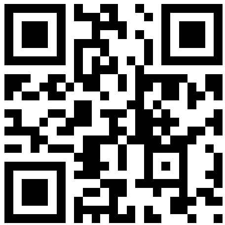
大直高中校園 防災教育IG

請各位同學加入本校校園防災教育FB粉絲專頁及IG，以獲取各項防災資訊的即時訊息；另外當學校有災害發生時也是統一告知家長之約定通訊管道，歡迎訂閱追蹤，掌握防災新知。