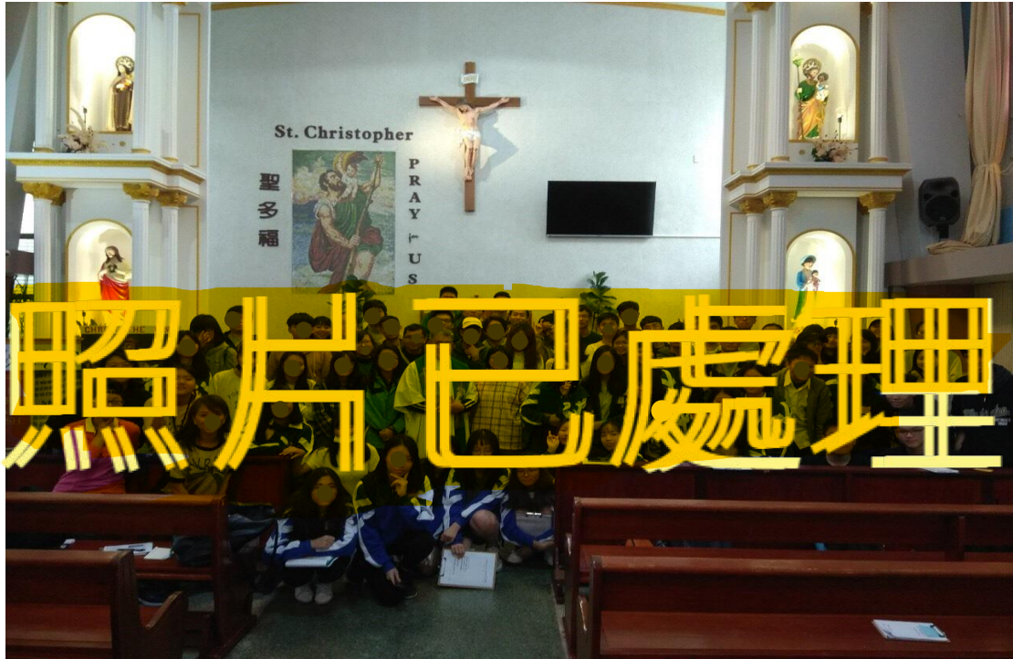
(蹲姿第一排由右數來第二位即為本人)

使我更了解外籍移工來台會面臨的困境。也許少一分歧視，多一分將心比心，能夠使移工朋友在台灣也能擁有一份歸屬感。