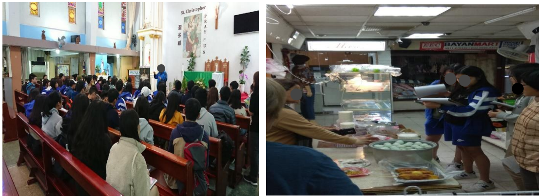
(上右圖右側由前至後第四位即為本人)

在此次實察課程中獲益良多，不僅增進紀錄、分析所見所聞的能力，也學會如何訪談商家，並且使我更了解移工的信仰文化和消費型態。